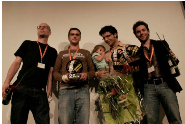
Les gagnants du festival Tourné-Monté de l'année passée

Le Super 8 est un format de film. La pellicule mesure 8mm de large. Aujourd'hui, dans les salles de cinéma, elle mesure 35mm, mais le principe est exactement le même. Les caméras Super8 n'ont pas de capteur CCD à plusieurs millions de pixel, ni de bande magnétique, mais une pellicule comparable au film des appareils photo argentiques. Une pellicule qu'il faut par ailleurs développer une fois le film tourné. Le festival s'en charge. Le film est ensuite projeté sur un écran blanc. Le Super8 est né il y a 40 ans et a eu son heure de gloire dans les années 70-80, détrôné par les caméscopes électroniques. On a cru le Super8 mort et enterré, mais depuis quelques années il bénéficie d'un regain d'intérêt et nombre de passionnés s'adonnent encore à cette forme de cinéma rétro, tant ses qualités sont nombreuses et son utilisation à la portée de toutes et tous.